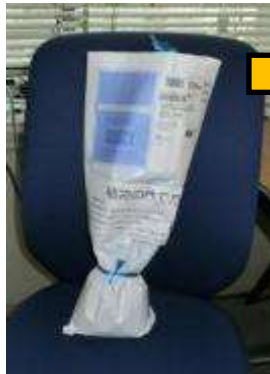
到着時の梱包状態