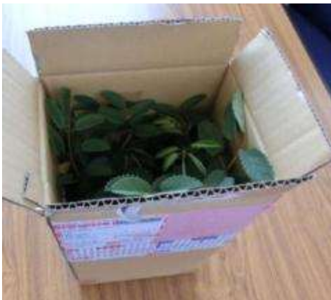
段ボール上部を開梱