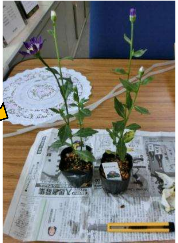
開梱した状態(花がキレイに咲いていた)