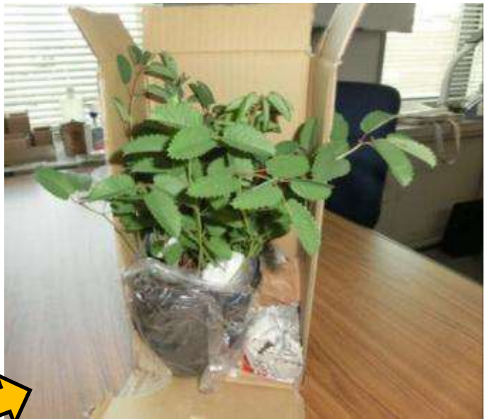
内部の状態(ビニールで水漏れが防止されている)