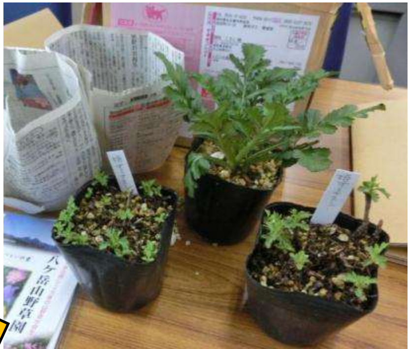
苗(中央はプレゼント)とパンフレット(左)