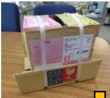
到着時の梱包状態