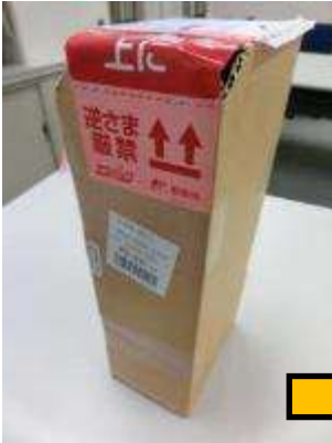
到着時の梱包状態