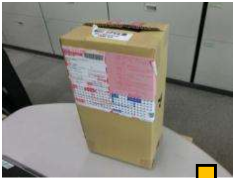
到着時の梱包状態