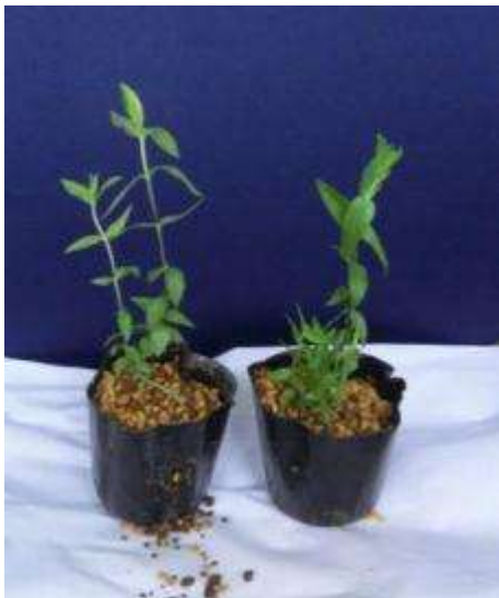
内袋を外した 苗の状態