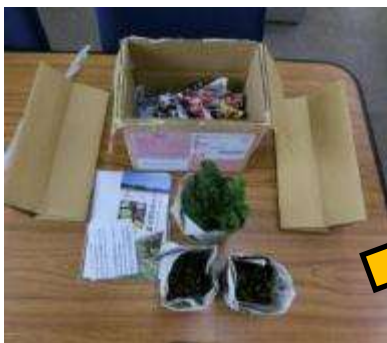
開梱状態(新聞で湿気をキープ)